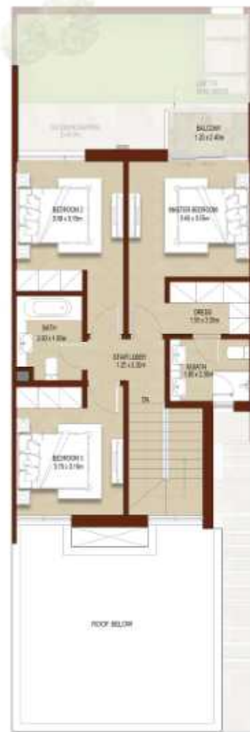
FIRST LEVEL الطابق الاول