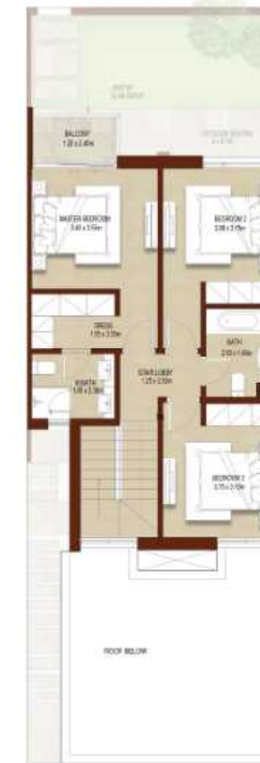
FIRST LEVEL الطابق الاول