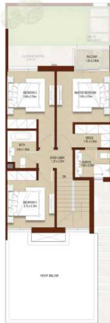
FIRST LEVEL الطابق الاول