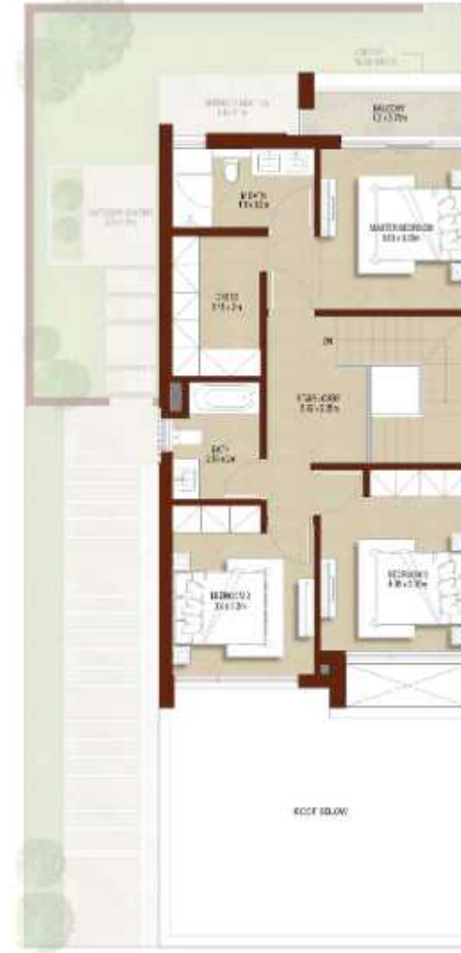
FIRST LEVEL الطابق الاول