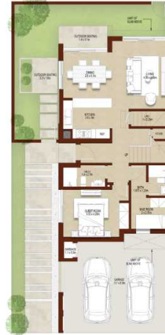
GROUND LEVEL الطابق الارضي