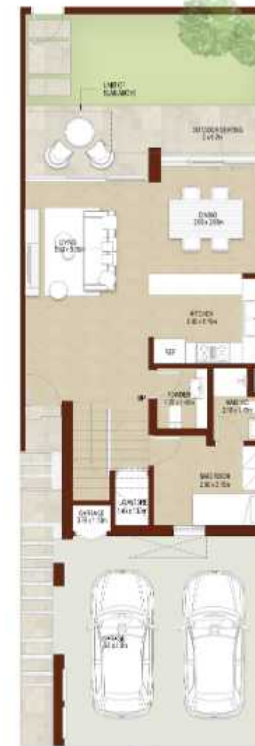
GROUND LEVEL الطابق الارضي