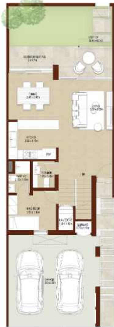
GROUND LEVEL الطابق الارضي