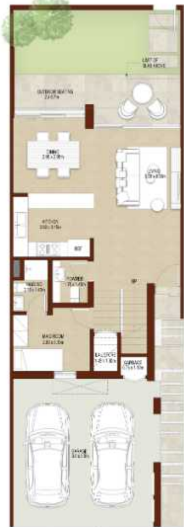
GROUND LEVEL الطابق الارضي