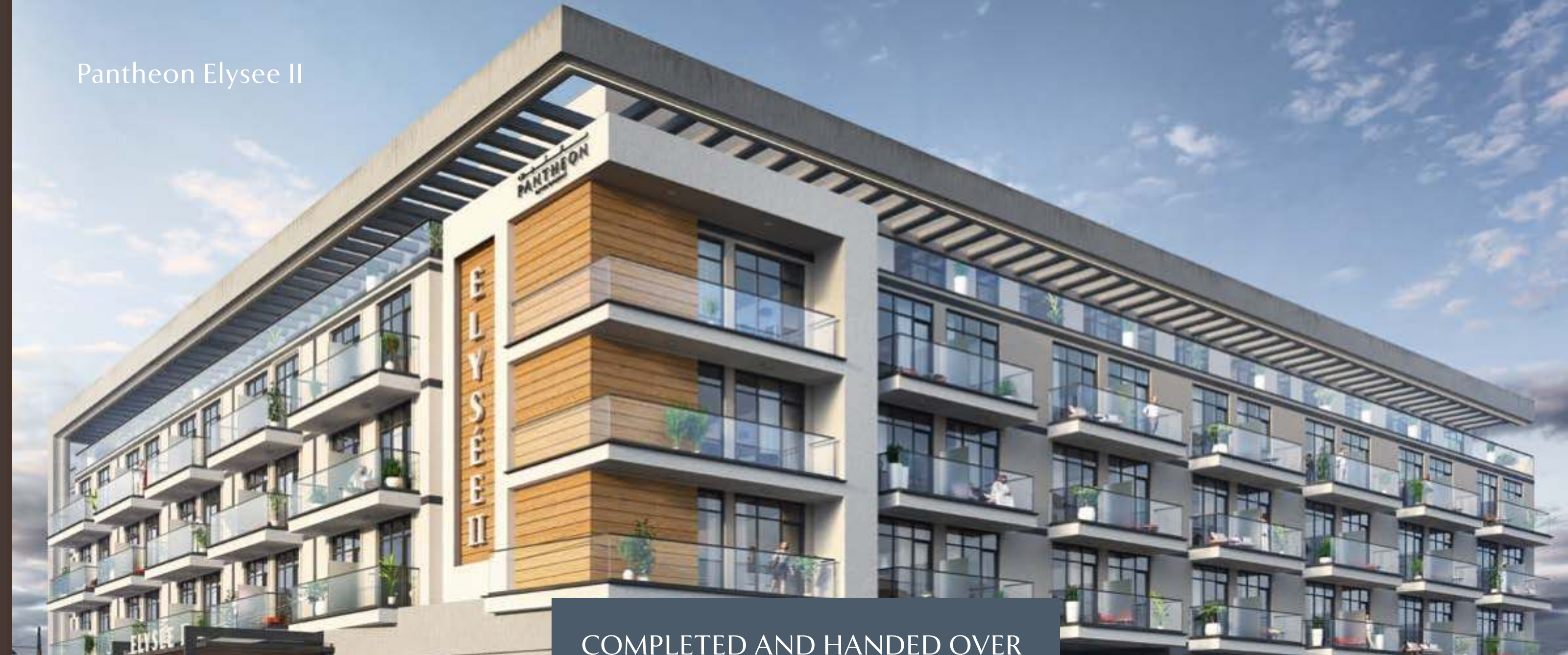
Pantheon Elysee II