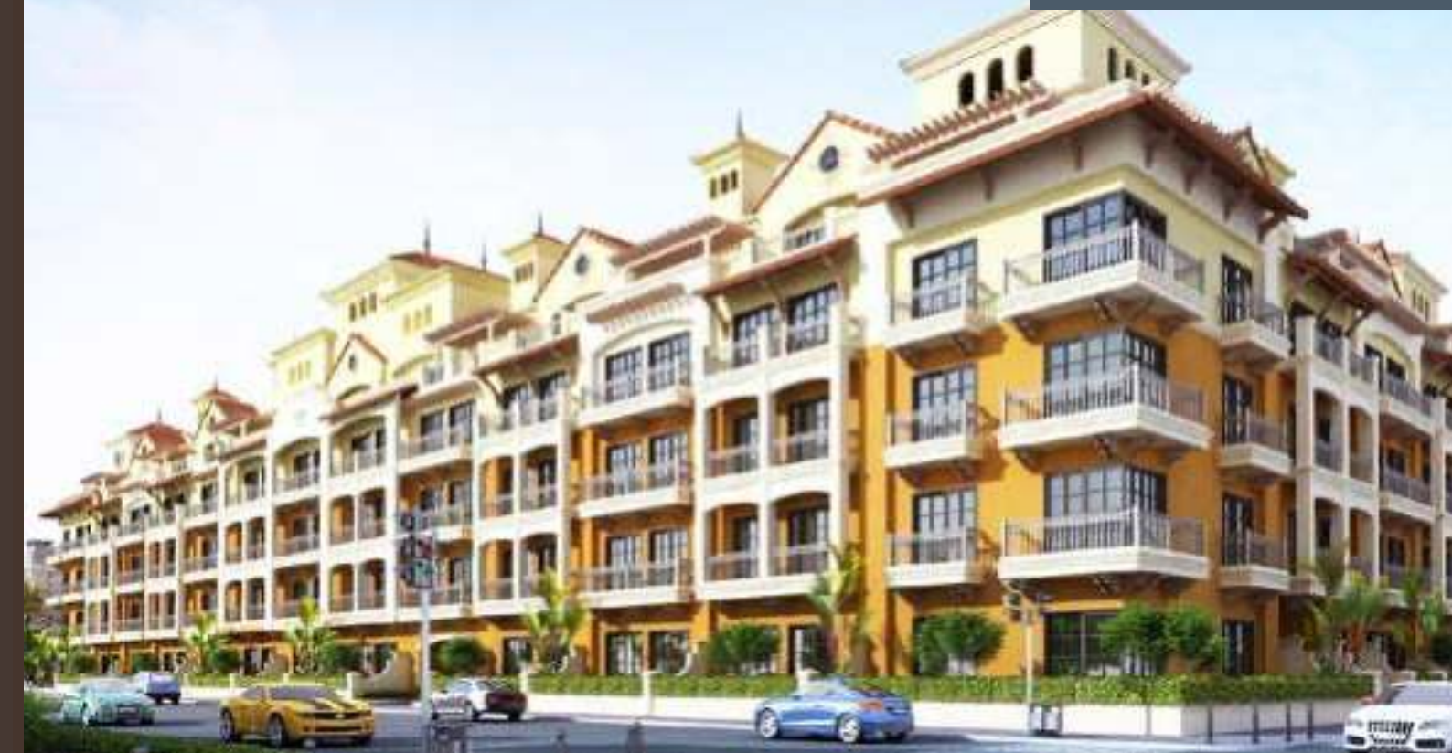
Pantheon Elysee I