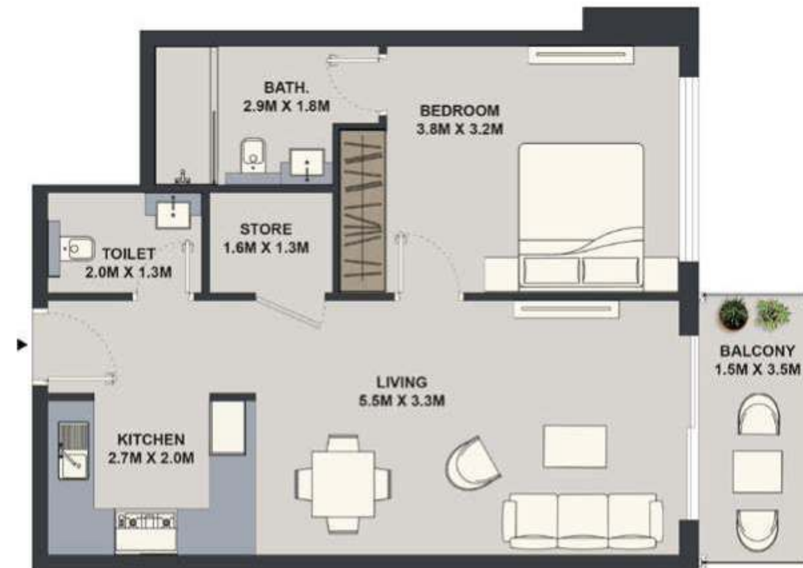
1BHK - TYPE 1