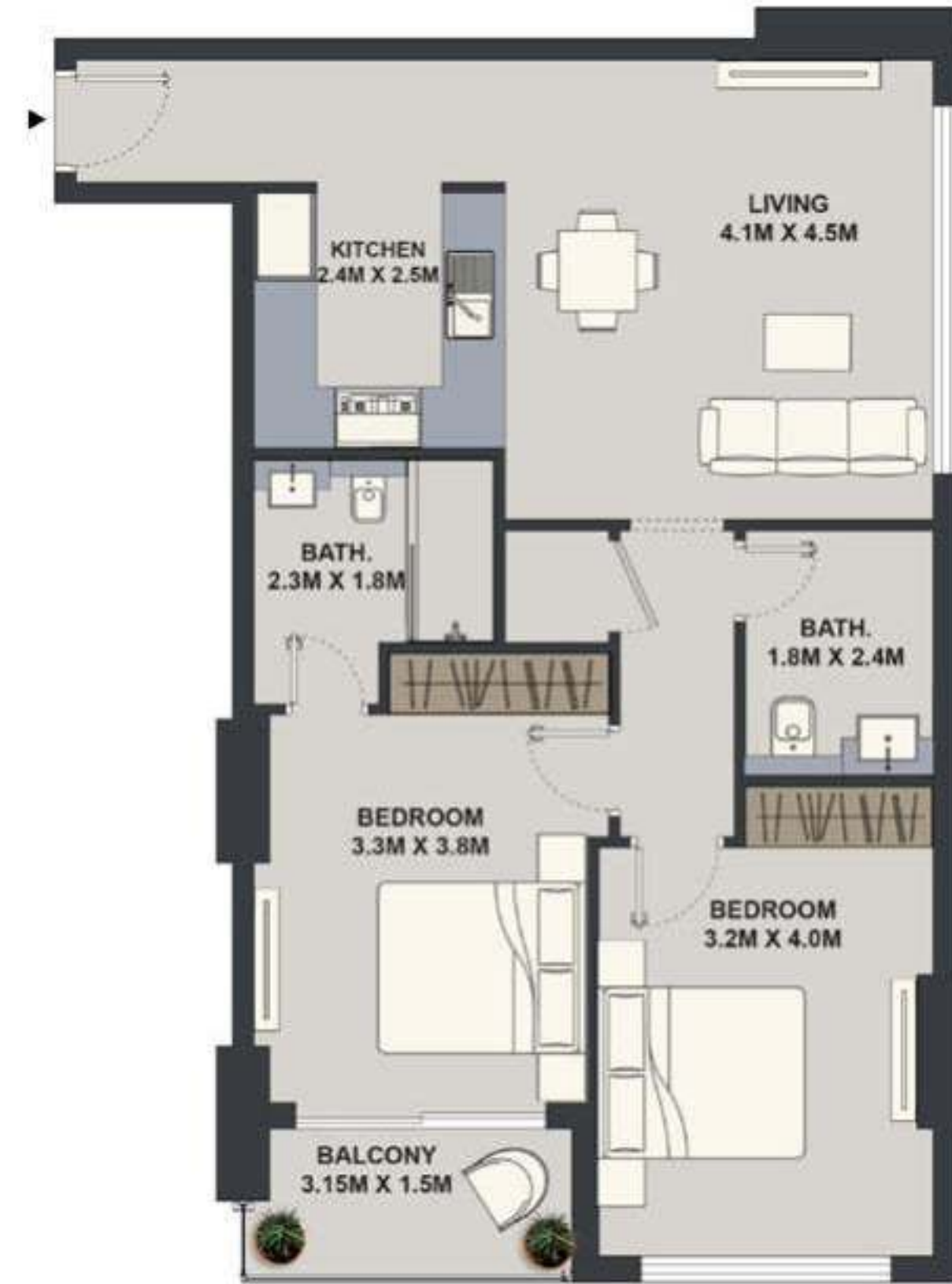
2BHK - TYPE 1