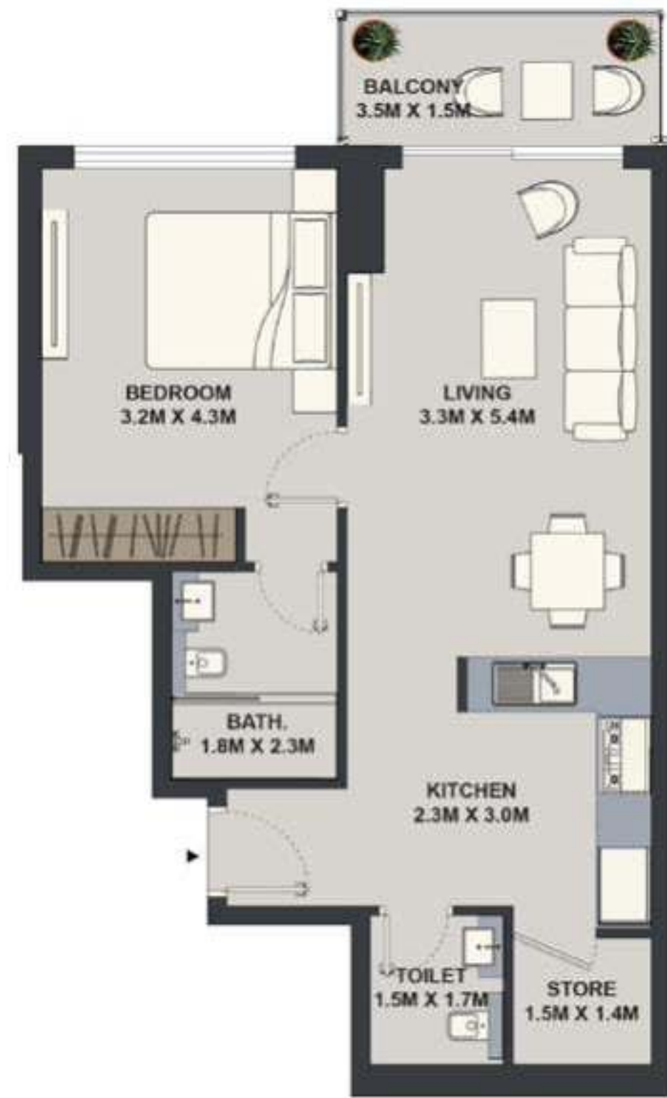
1BHK - TYPE 3