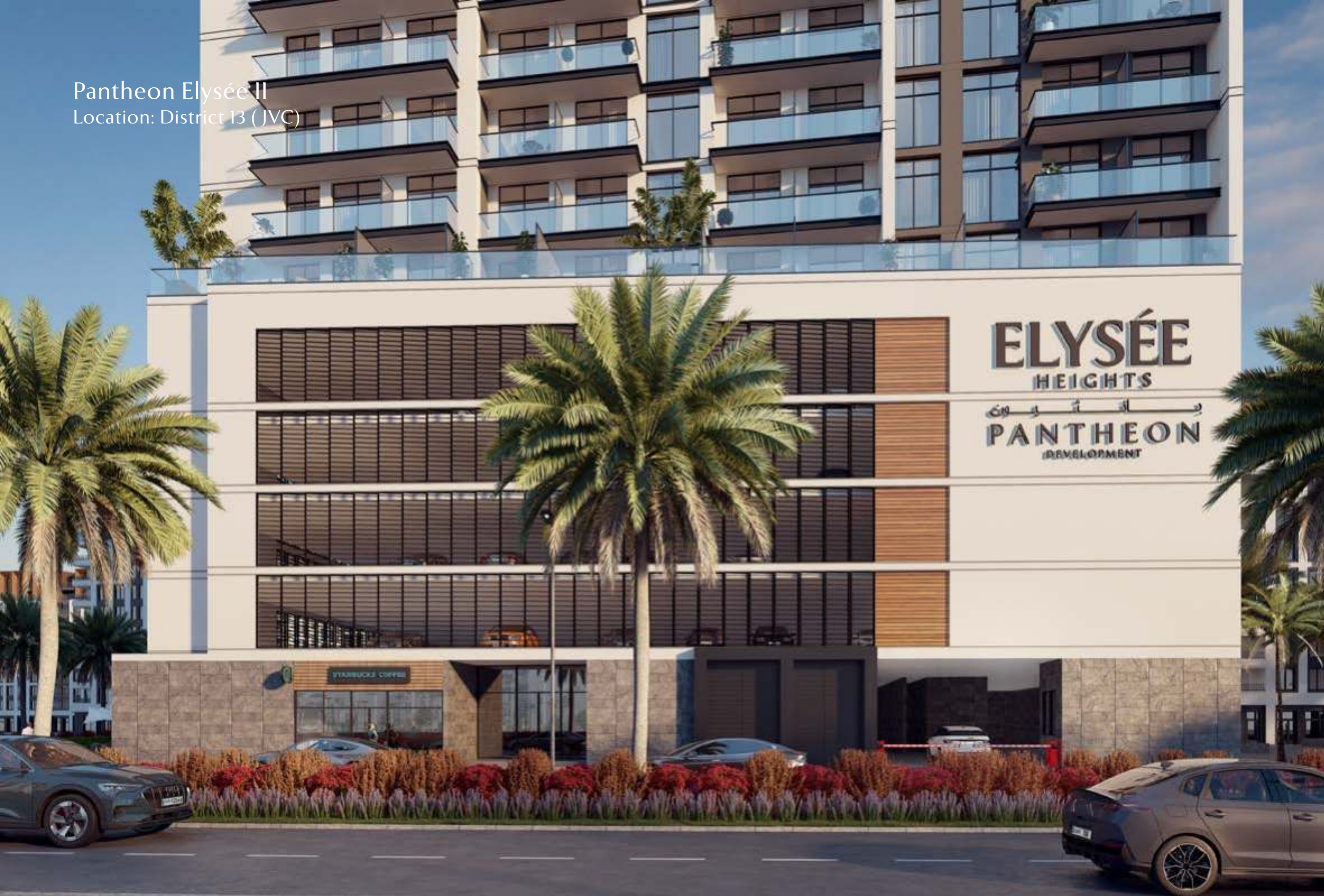
Pantheon Elysée II Location: District 13 (JVC)