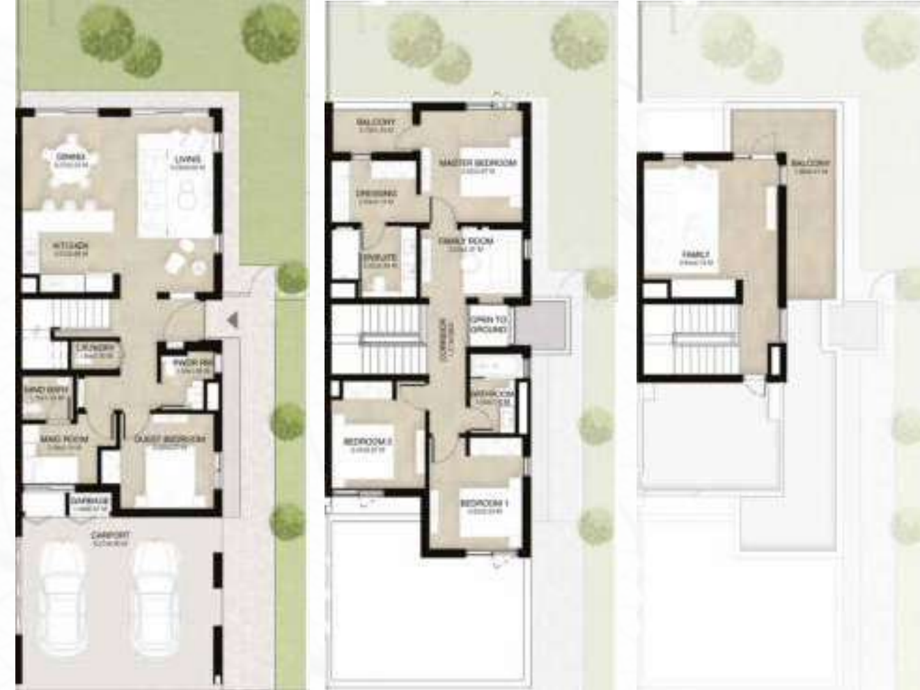
GROUND LEVEL الطابق الأرضي FIRST LEVEL الطابق الأول ROOF LEVEL السطح

4 غرف نوم + غرفة عائلية و غرفة خادمة - الوحدة النهائية (معكوسة)