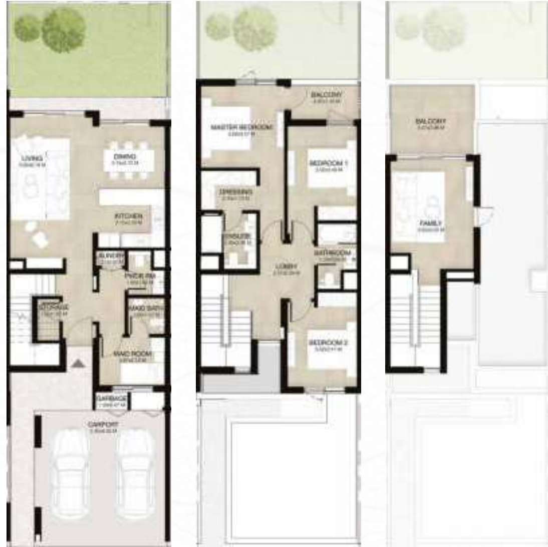
GROUND LEVEL الطابق الأرضي FIRST LEVEL الطابق الأول ROOF LEVEL السطح

3 غرف نوم + غرفة عائلية و غرفة خادمة - الوحدة المتوسطة المساحة الكلية: 238.55 متر مربع / 2,568 قدم مربع 3-BEDROOM+FAMILY & MAID - MID UNIT TOTAL AREA: 238.55 SQM / 2,568 SQFT