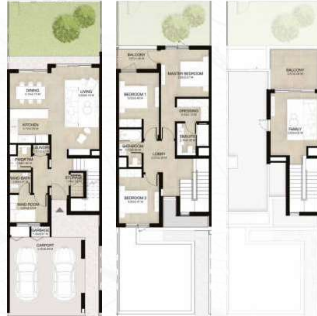
GROUND LEVEL الطابق الأرضي FIRST LEVEL الطابق الأول ROOF LEVEL السطح

3 غرف نوم + غرفة عائلية و غرفة خادمة - الوحدة المتوسطة (معكوسة) المساحة الكلية: 238.55 متر مربع / 2,568 قدم مربع 3-BEDROOM+FAMILY & MAID - MID UNIT (MIRRORED) TOTAL AREA: 238.55 SQM / 2,568 SQFT