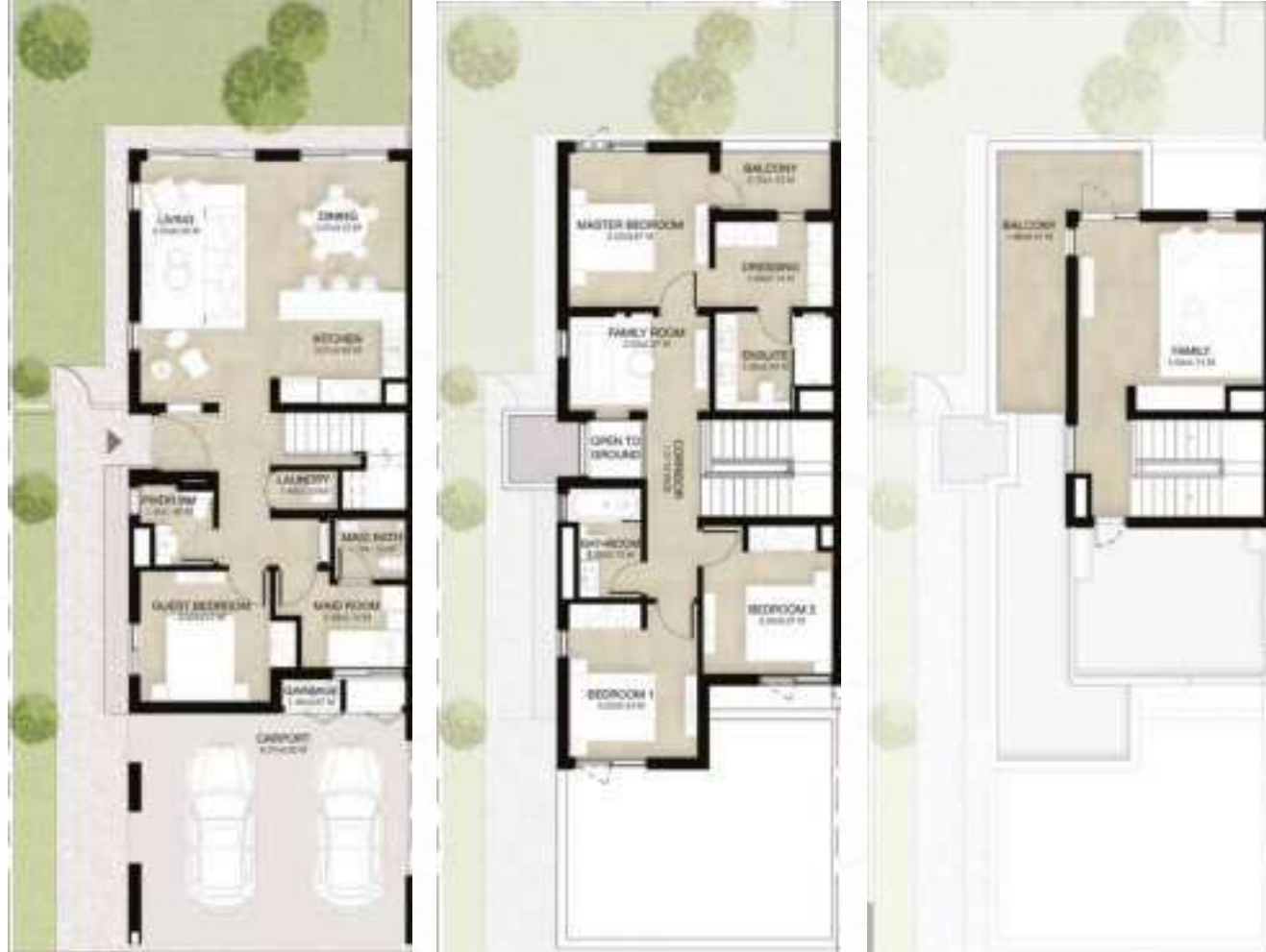
GROUND LEVEL الطابق الأرضي FIRST LEVEL الطابق الأول ROOF LEVEL السطح

4 غرف نوم + غرفة عائلية و غرفة خادمة - الوحدة النهائية